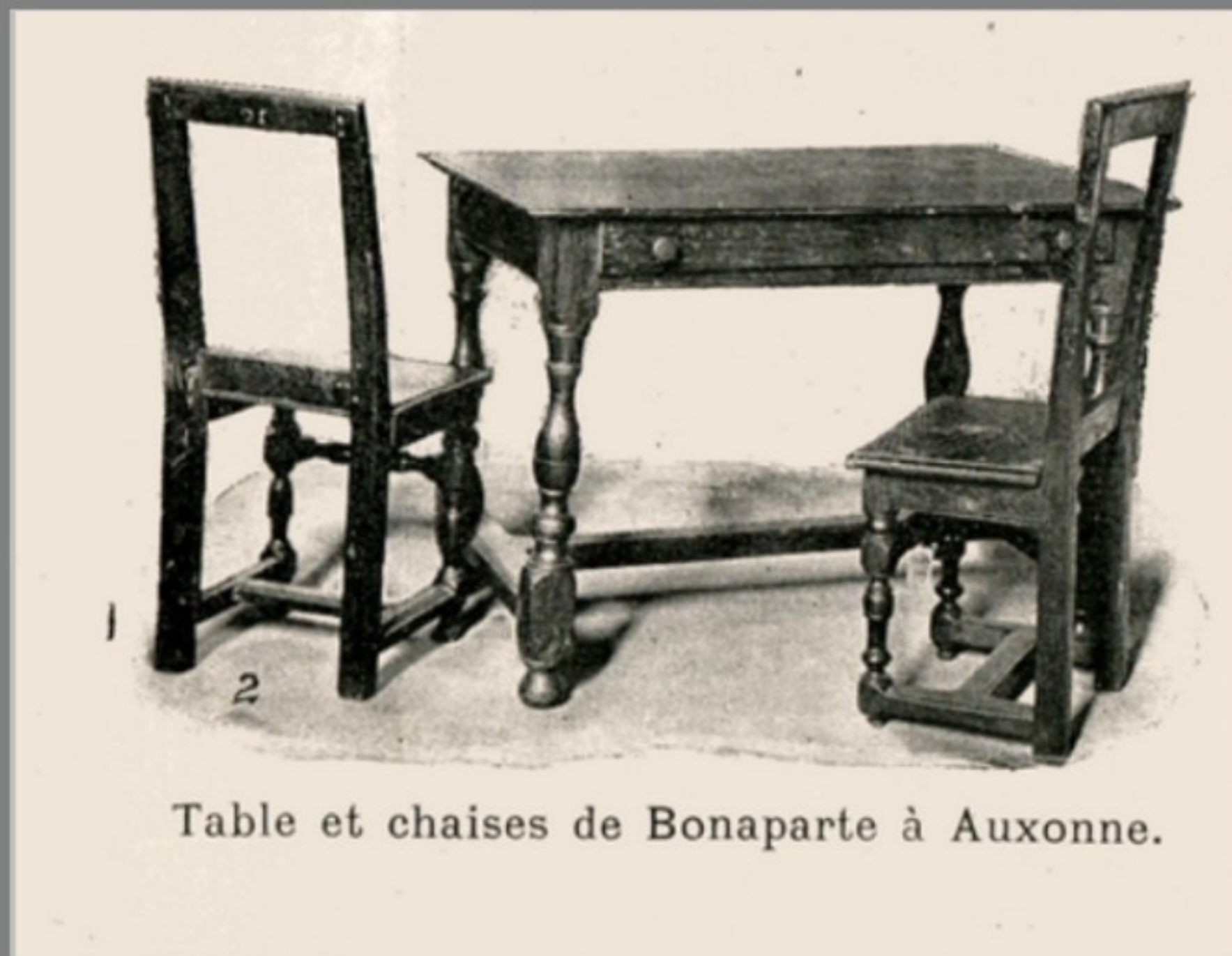
Table et chaises de Bonaparte à Auxonne.

L'image ci-contre parue dans le numéro de "L'illustration" du 3 juillet 1897 parlera sans doute à tous les "napobranchés".