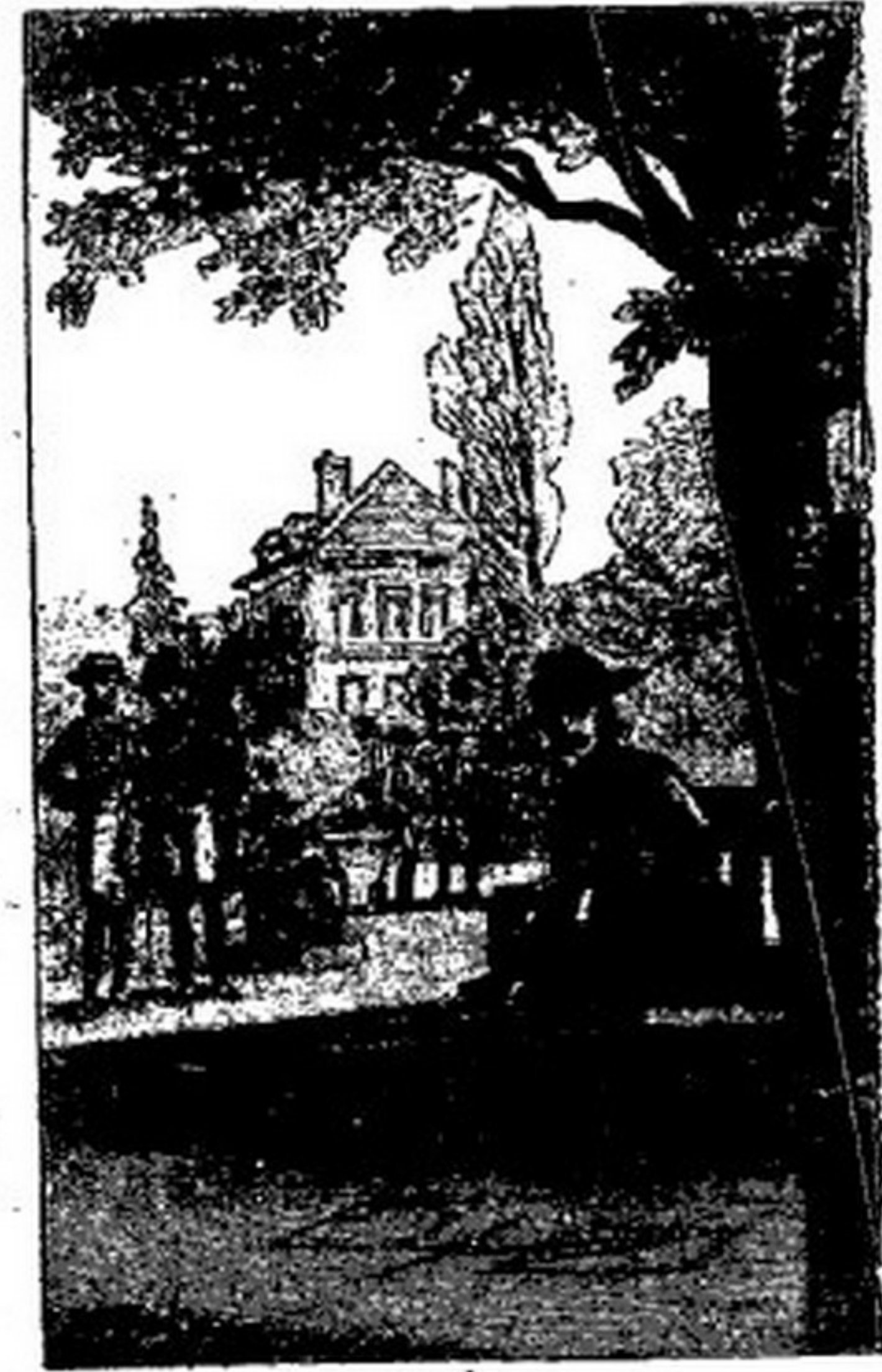
NAPOLÉON AU COLLÈGE DE BRIENNE.

En 1784, à l'âge de quinze ans, il fut reçu à l'École militaire de Paris. A la fin de l'année, il fut nommé sous-lieutenant d'artillerie.