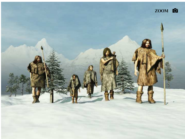
Des biologistes viennent de montrer que Neandertal pouvait aussi bien manger de la viande que des végétaux. Et surtout s'automédiquer.

Des biologistes viennent de montrer que Neandertal pouvait aussi bien manger de la viande que des végétaux. Et surtout s'automédiquer avec des plantes.