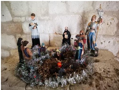
Ste Foy de Jérusalem