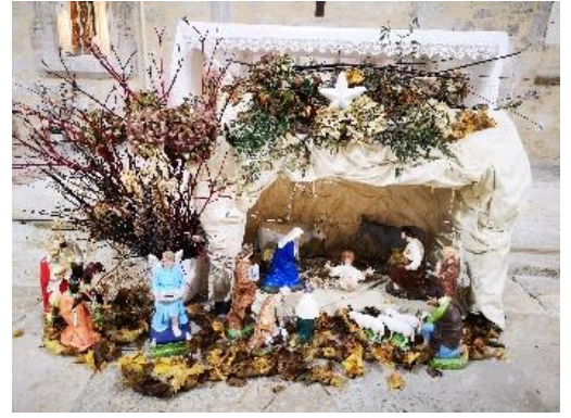
La Croix Blanche