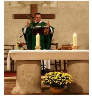
Saint Martin du Caoulet (Foulayronnes)

Dans notre paroisse Sainte-Marie en Agenais, après les messes honorant les saints patrons des 10 églises, il y a un apéro paroissial appelé Verre de l'amitié, ce fut le cas ces derniers temps pour les 2 églises Saint Martin de la paroisse (27 octobre et 10 novembre 2024) et cela réchauffe vraiment le cœur des fidèles.