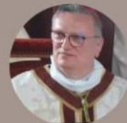
Monseigneur de Bucy Evêque d'Agen

La vertu d'espérance : Comment garder la foi dans un monde souvent marqué par la violence et le mal ?