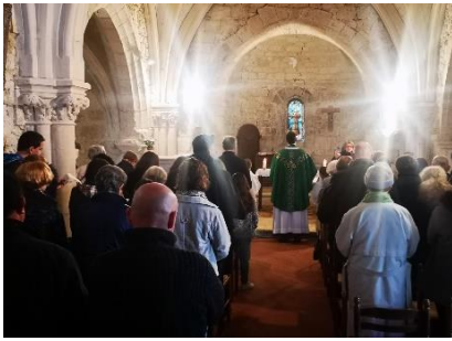
Saint Martin de Serres (Bajamont)