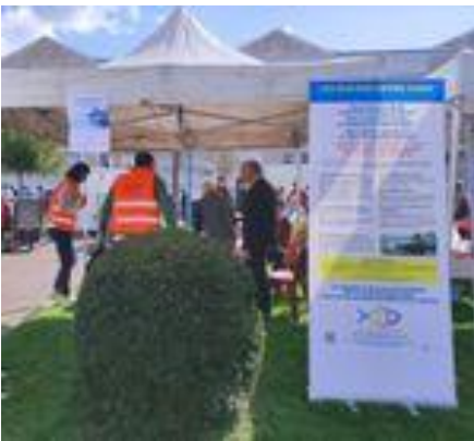
Congrès-Mission Le Passage d'Agen le 28 septembre

puis le 29 septembre en paroisse Ste Marie en Agenais