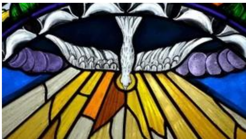
Futur vitrail de Notre Dame de Paris

Accueillons Avec toute l'Eglise Les dons de l'Esprit Saint !