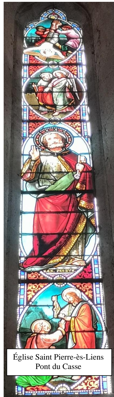
Église Saint Pierre-ès-Liens Pont du Casse

Saint Augustin répondrait que « Pierre en a fait plus de cas que de l'or le plus pur et le plus précieux ». Car elle rappelle jusqu'ou peut conduire l'attachement au Christ, lequel, comme Il l'a fait dans la prison de Jérusalem, lie et délie, faisant tomber ou pas les attaches humaines du péché ou des geôles.