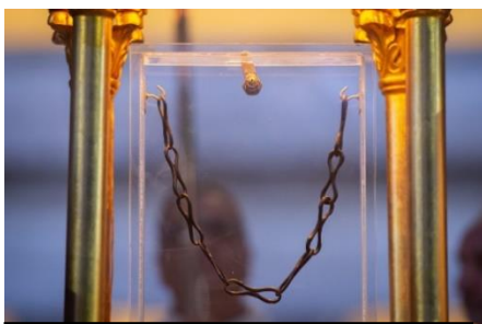
Les chaînes furent conservées. Elles sont unies et gardées en l'église St Pierre-aux-Liens de Rome

À Rome on conserve avec le même soin qu'à Jérusalem d'autres chaînes de Pierre, celles qu'il a portées dans son cachot de la prison Mamertine, lors de son emprisonnement de 64-65 qui s'achèvera par sa mort, crucifié la tête en bas dans le cirque du Vatican, annexe d'un palais impérial cher à Néron. La Tradition veut qu'elles aient été récupérées, sur le conseil du pape martyr Alexandre Ier par une patricienne chrétienne, Balbina. Eudoxie juge donc normal de rassembler tous ces fers dont elle fait cadeau, début août 439, au pape Sixte III. Or, à l'instant où les chaînes venues de Jérusalem sont posées près des chaînes romaines, devant l'assistance médusée, elles se rejoignent et n'en font bientôt plus qu'une seule.