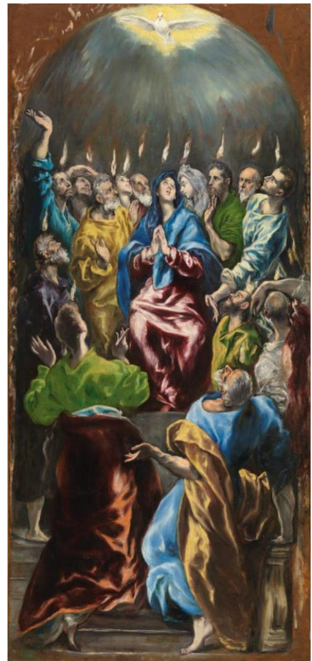
La pentecôte, El Greco

Le Catéchisme de l'Église Catholique (CEC) enseigne que " Les 7 dons du Saint Esprit sont la sagesse, l'intelligence, le conseil, la force, la science, la piété et la crainte de Dieu. Ils appartiennent en leur plénitude au Christ, Fils de David. Ils complètent et mènent à leur perfection, les vertus de ceux qui les reçoivent. Ce sont des dispositions permanentes, qui rendent les fidèles capables de suivre les impulsions de l'Esprit Saint. " (CEC n° 1830-1831).