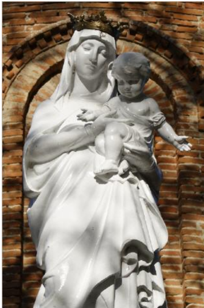
Abbaye Sainte Marie du Désert, chapelle du pèlerinage Vierge couronnée à l'enfant

Dieu, qui, par la Résurrection de Ton Fils, notre Seigneur Jésus-Christ, a bien voulu réjouir le monde, fais-nous parvenir, par la prière de la Vierge Marie, sa mère, aux joies de la vie éternelle. Par le Christ notre Seigneur. Amen.