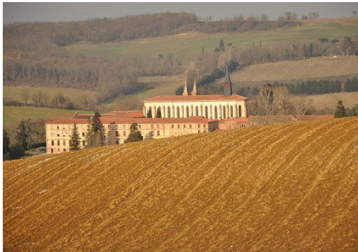
Abbaye Sainte Marie du Désert