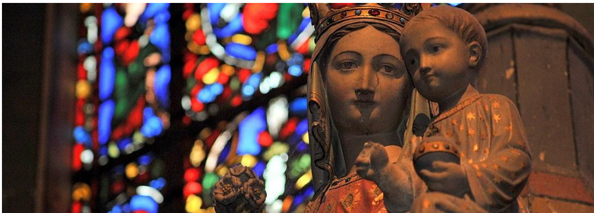
Vierge à l'enfant (XIXe s.) - Cathédrale de Beauvais

Adieu, ô toute belle, et prie le Christ pour nous.