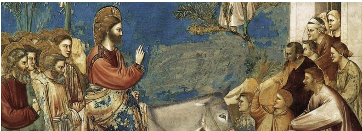
Giotto di Bondone - L'entrée du Christ à Jérusalem - Détail - Fresque, 200 x 185 cm - 1304-1306 - Chapelle des Scrovegni (chapelle de l'Arena), Padoue

Comme Jésus entra à Jérusalem, toute la ville fut en proie à l'agitation, et disait : « Qui est cet homme ? » Et les foules répondaient : « C'est le prophète Jésus, de Nazareth en Galilée. »