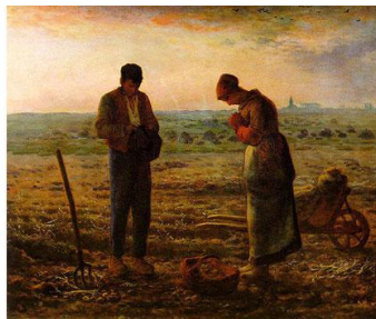
Œuvre de J-F Millet

Ces trois moments font mémoire, chaque jour, de la fête que nous célébrons demain et que nous anticipons ce soir : l'Annonciation. Il s'agit de la visite de l'Ange Gabriel à la jeune Marie de Nazareth. Il vient de la part du Seigneur pour lui demander de porter l'humanité du Fils qui sera conçue en elle par l'Esprit Saint.