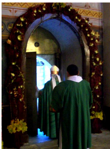
Fermeture Porte Sainte de la cathédrale d'Agen

Le Jubilé extraordinaire de la miséricorde, s'est conclu, le dimanche du Christ Roi de l'Univers, ce 20 novembre avec la fermeture de la Porte Sainte de la basilique Saint-Pierre. Deux documents programmatiques nous en donnent le sens : la Bulle d'Indiction de l'Année Sainte, Misericordiae vultus , et la Lettre apostolique Misericordia et misera , du pape François.