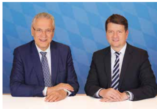
Joachim Herrmann, MdL Staatsminister

Bayern baut die Arbeitsgelegenheiten seit Jahren konsequent aus. Mit diesem Leitfaden wollen wir alle potentiellen Träger ermutigen, Arbeitsgelegenheiten nach dem Asylbewerberleistungsgesetz zu schaffen.