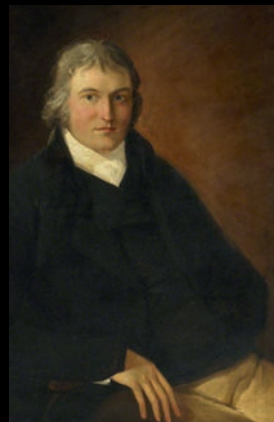
Jan Ladislav Dussek (1760-1812), anonyme