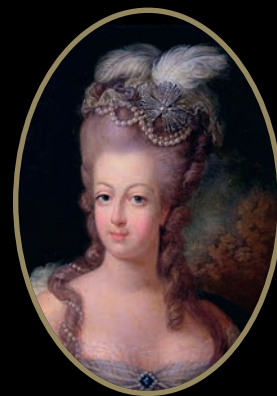
Portrait de la reine Marie-Antoinette en 1775. Jean-Baptiste André Gautier d'Agoty © Musée Antoine-Lécuyer

11 20h30 / Besançon, Musée des Beaux-Arts et d'Archéologie place de la Révolution