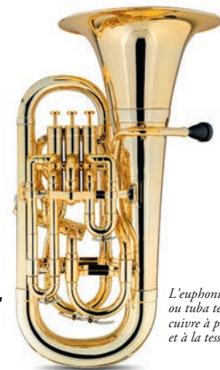
L'euphonium, ou tuba ténor, cuivre à perce conique et à la tessiture grave

► Entrée libre dans la limite des places assises disponibles. Réservation par mail : com.festivalmontfaucon@gmail.com Participation au chapeau, faites un don pour aider le festival !