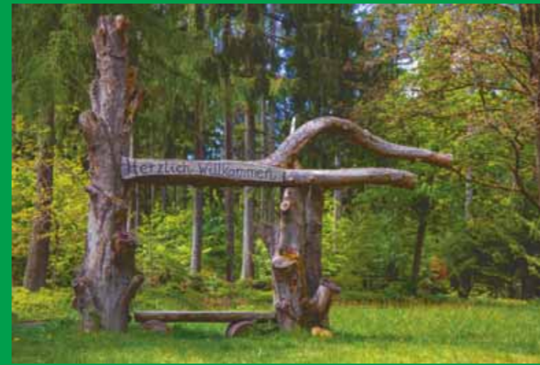
Willkommensgruß am Ortseingang von Mosborn

Kontakt und Infos: Vereinigung für Heimstätten der Sozialistischen Jugend, Bezirk Hessen/Süd e.V. Am Lohberg 11, 64367 Mühlthal, Tel.: 06151/9500701, Fax: 9500700 eMail: vfh@falken-hessen.de Homepage: www.vfh-falken-hessen.de