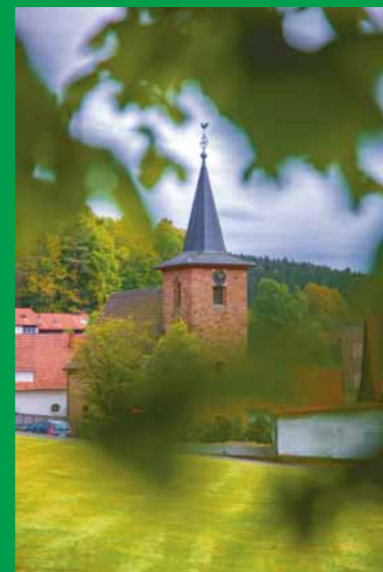
Der Turm der St.-Johannes-Kirche in Flörsbach