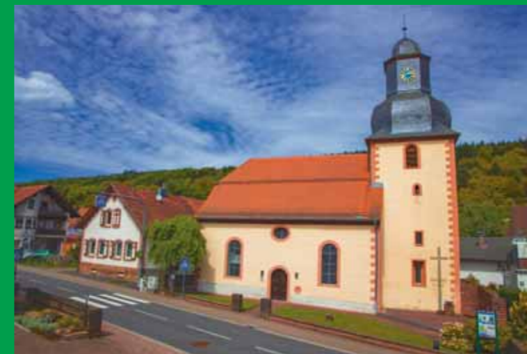
Die Kirche „St. Marien“ in Kempfenbrunn