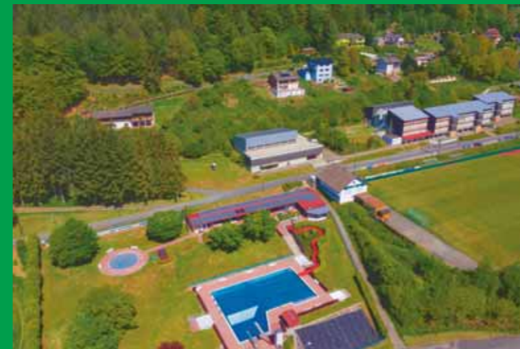
Blick auf Freibad mit Sportplatz und Schulgelände