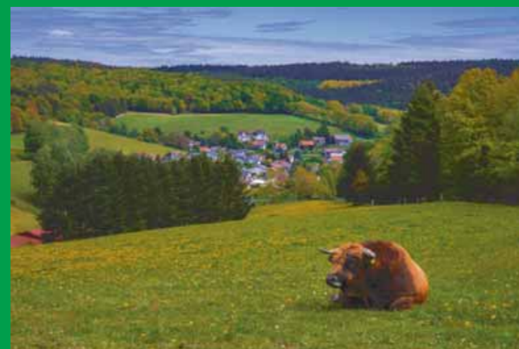
Idyllischer Blick auf Flörsbach vom Hartgrund aus