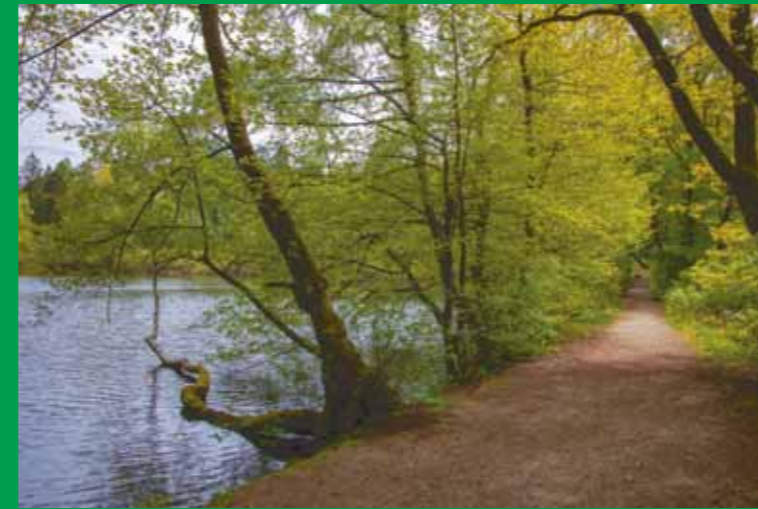
Blick auf den Wiesbüttsee mit dem Wanderweg, der die Grenze zu Bayern bildet