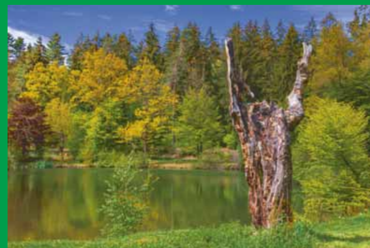
Der so genannte Pflingstweiher zwischen Kempfenbrunn und Mosborn