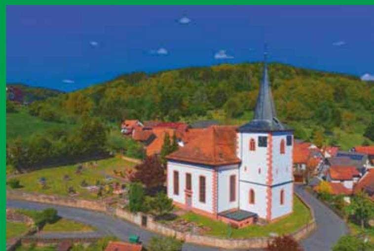
Die Matthäus-Kirche in Lohrhaupten