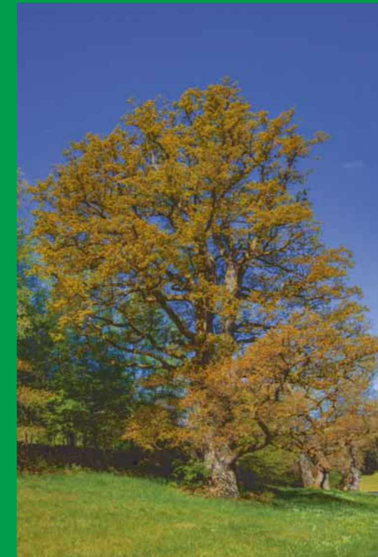
Die „Kreuzel-Eichen“, gelegen neben der Straße zur Bayrischen Schanz