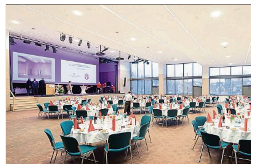
Der große Saal.

Mainfrankensälen übernehmen, egal ob Gala-Bankett oder Geschäftsmeeting. Veranstalter haben aber die Wahl, für die Bewirtung des Saales auch auf andere ausgesuchte Carterer zurückzugreifen. Dafür wurde neben der Küche des Restaurants ein eigener Carterer-Raum mit Scherenbühne von außen eingerichtet. > B52