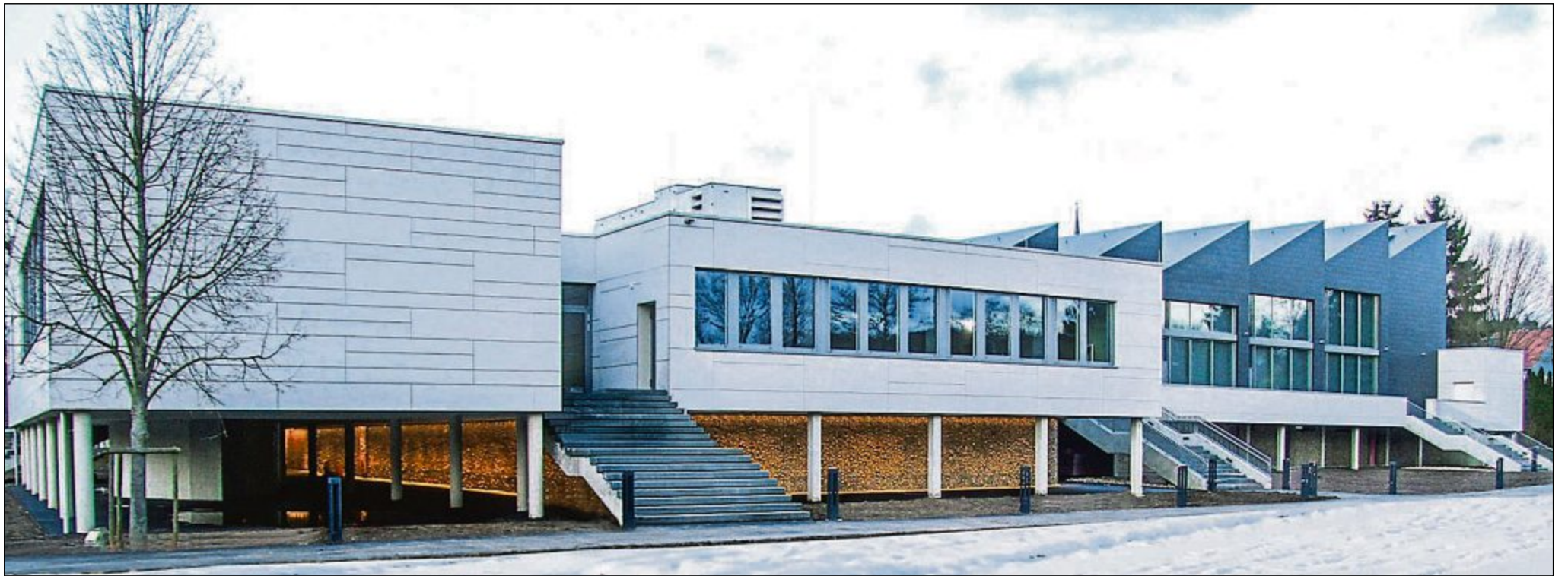
Die Mainfrankensäle in Veitshöchheim.

Die im Jahr 1981 mit einem teilbaren Saal eröffneten Mainfrankensäle mit einem Fassungsvermögen von bis zu 800 Besuchern wurden deshalb zeitgemäß umgebaut, energetisch und funktional verbessert sowie durch einen Anbau zur Mainseite hin um zusätzliche Räumlichkeiten erweitert. Die mehrere Jahre in einem Arbeitskreis mit Vertretern aller Fraktionen funktional, ästhetisch, räumlich und technisch optimal abgesprochene Planung beseitigte funktionale Defizite und schaffte ein 727 Quadratmeter großes zentrales Foyer sowie zusätzliche Räu-