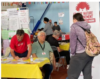
Forum VSD Photo M. Turgis