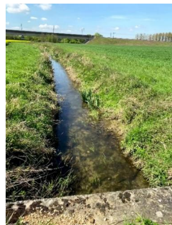
Site de Crisenoy – ru d'Andy

* Association pour la protection des terres agricoles, de l'environnement et du cadre de vie