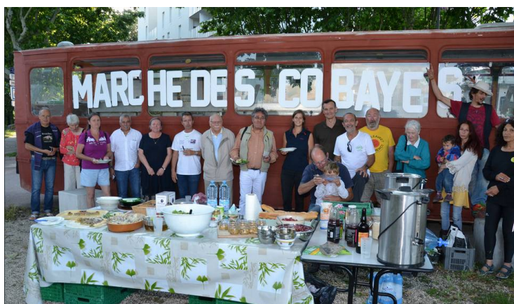
Le camion qui concocte la nourriture des marcheurs

Un pique-nique convivial est organisé dans le parc près de la mairie de Fontaine-le-Port.