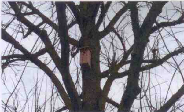
Les services techniques de la ville ont installé les nichoirs sous les yeux émerveillés des enfants.