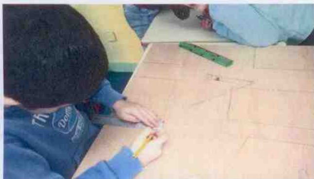
Les enfants ont tracé les traits sur la planche.

- AGIR , nous avons construit des nichoirs (un nichoir par groupe de 3 enfants). Les enfants ont dans un premier temps, tracé les traits sur les planches. Puis, ils ont assemblé les planches. Un parent d'élève, présent ce jour-là, a préparé les trous avec la perceuse afin de favoriser l'entrée des vis par les enfants. Pour finir, nous sommes allés installer les nichoirs dans la commune, près de l'école et dans le parc du château. La découpe des planches et l'installation des nichoirs ont été réalisées par les services techniques de la ville.