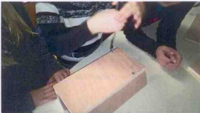
Les enfants ont assemblé les 6 faces.