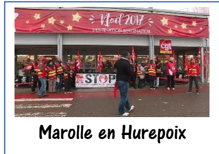
Marolle en Hurepoix

Plusieurs centaines de salariés ont débrayés sur tout le territoire suite à l'appel à la grève initié par la CGT du Groupe Carrefour les 22 & 23 décembre dernier.