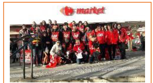
Hyper Chalezeule Besançon