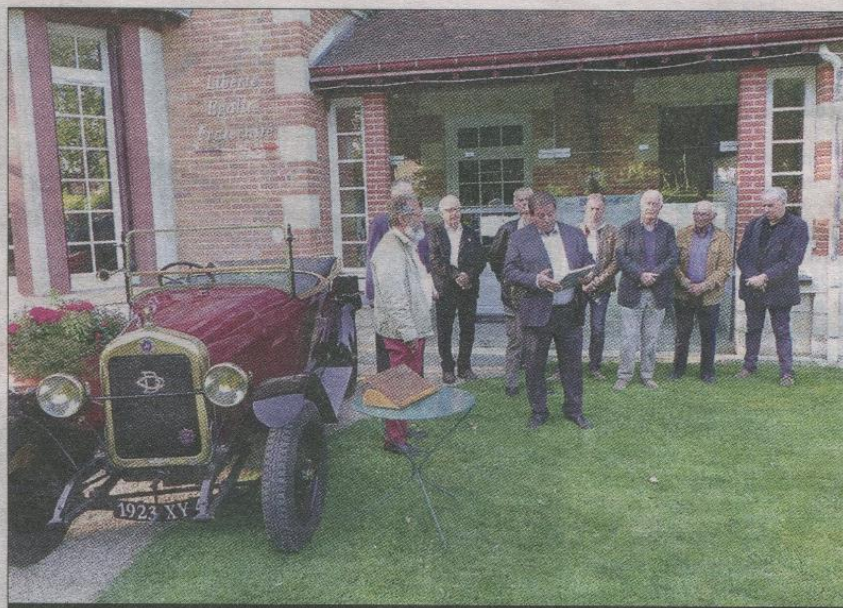
DELAUGÈRE. Remise des premiers exemplaires, en présence d'une des 27 voitures survivantes.

« Nous avons voulu, grâce à cet ouvrage, faire sor-