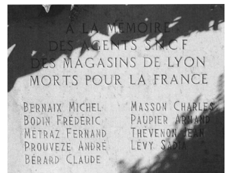
Stèle Magasins d'Oullins