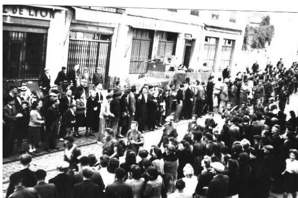
Oullins est libérée le 3 septembre 1944