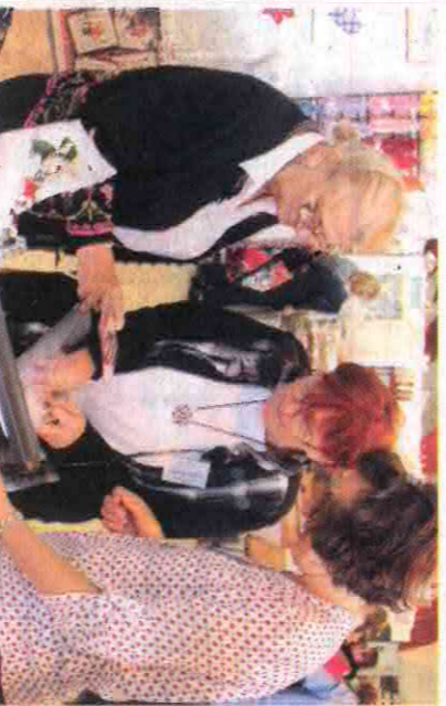
Une exposante venue d'Allemagne brode sur tout...