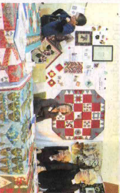
France Patchwork Oise propose des stages.