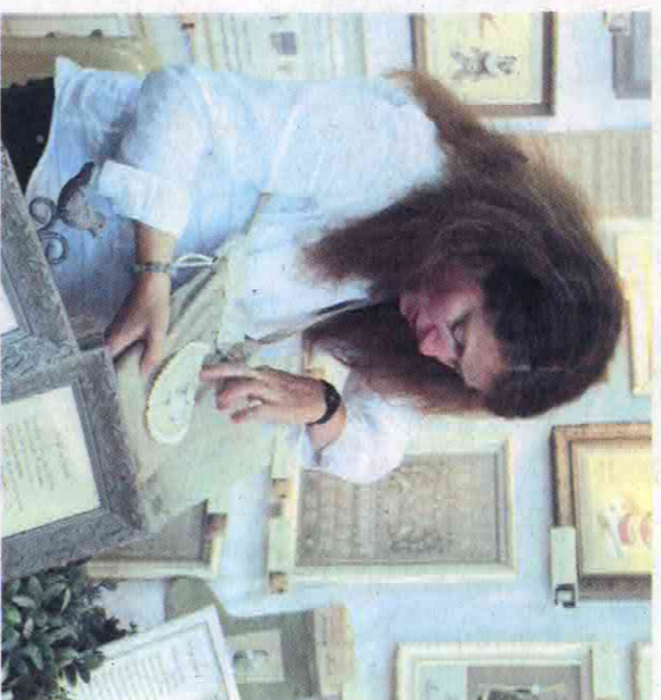
Le point de croix reste un grand classique.

Pour le Lions Club de Royal-Lieu, les bénéfices générés par les entrées, la location des stands et la restauration buvette, permettent d'apporter une aide supplémentaire aux gens qui en ont besoin.