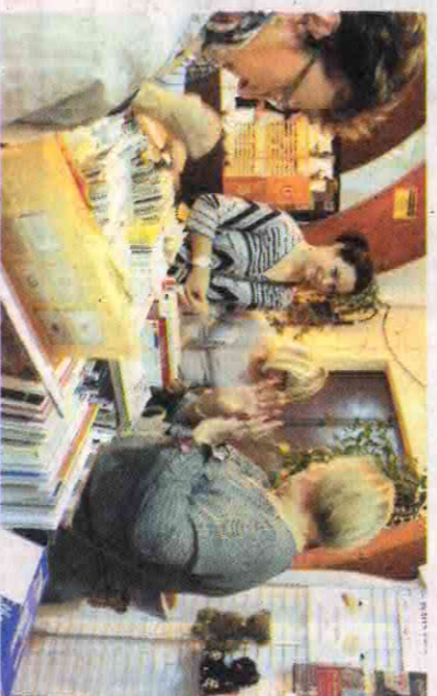
Les livres restent une bonne base pour avoir des idées.