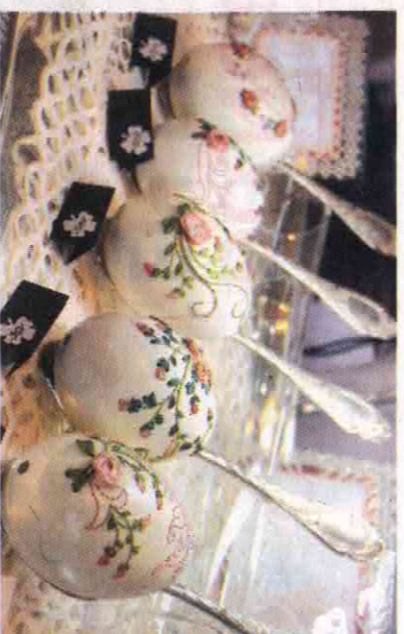
...Y compris sur les œufs !