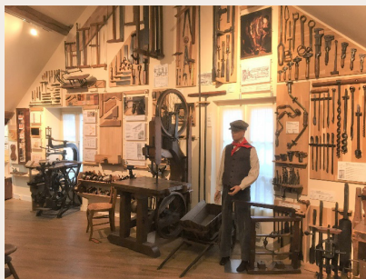
Le Musée de l'outil