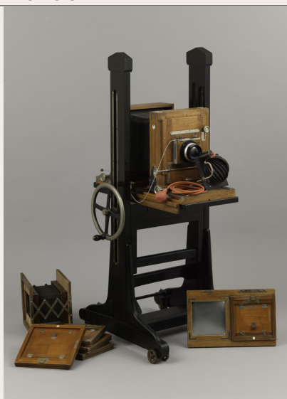
Chambre d'atelier Globus K 18x24 - v. 1895