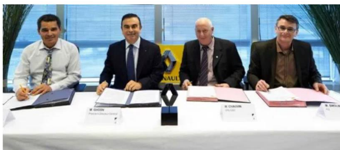
L'accord de compétitivité entre Renault et trois syndicats signé aujourd'hui s'intitule "Contrat pour une nouvelle dynamique de croissance et de développement social de Renault en France". Tout un programme.

2013-2016 : « Contrat pour une nouvelle dynamique de croissance et de développement social de Renault en France » signé le 13 mars 2013