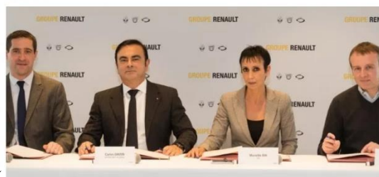
Le 13 janvier 2017, le Président-Directeur Général du groupe Renault, Carlos Ghosn, et les représentants des organisations syndicales CFDT, CFE-CGC et FO, ont signé l'accord Renault France - CAP 2020.

Renault France - CAP 2020 : Signature d'un Contrat d'Activité pour une Performance durable de Renault en France