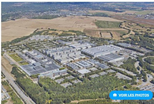
Au Technocentre de Guyancourt, Renault souhaite détruire le Gradient (au fond à gauche, près des champs), vide depuis juin 2023, pour économiser environ 1 million d'euros par an.

Publié le 13/05/2024 - 14:30 Mis à jour le 14/05/2024 - 14:06.