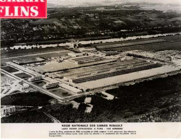
REGIE NATIONALE DES USINES RENAULT USINE PIERRE LEFAUCHEUX, A FLINS - VUE AERIENNE L'usine de Flins, construite en 1951 et doublée en 1956, occupe 70 000 mètres carrés. Son effectif actuel est de 25 000 personnes. C'est une usine dédiée à la production de véhicules, de la Peugeot 205 à la Renault 5.

1952 : Inauguration de l'Usine RENAULT FLINS « Fierté de l'industrie Française »