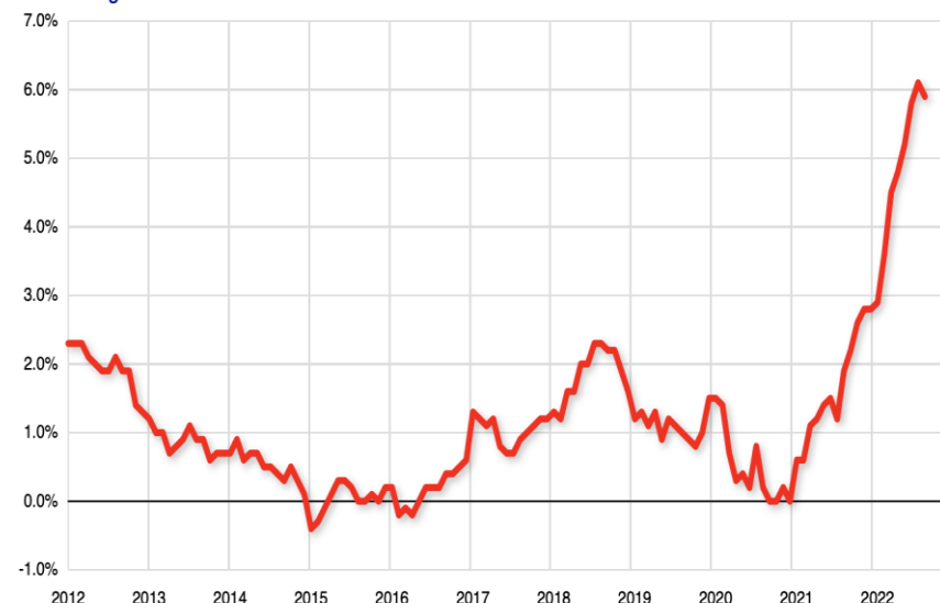
Inflation en glissement annuel.

SUD estime à 300€/mois minimum et pour tous la revalorisation des salaires nécessaire pour compenser les pertes de ces dernières années !