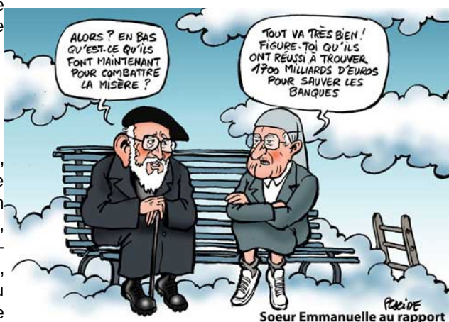
Sœur Emmanuelle au rapport

Pour imposer cette politique, le gouvernement s'est engagé dans une fuite en avant répressive sans précédent, pour dissuader toutes résistances. Mais les interdictions de manifester (avec leur pluie d'amendes injustifiées), les milliers de contrôles préventifs, les centaines de condamnation, dont 800 à des peines de prison ferme, les milliers de blessés, dont 22 éborgnées et 5 mains arrachées, ne mettront pas fin à la mobilisation. Car le mécontentement est profond et la colère s'étend et s'exprime dans une multitude de conflits locaux.