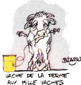
VACHE DE LA FERME AUX MILLE VACHES

objectif est d'enrichir les multinationales, au mépris de la qualité de l'alimentation et des conditions de travail des salariés. Jugée puis relaxée par la Cour d'Appel d'Amiens après avoir participé au démontage pacifique de la salle de traite de la ferme des 1000 vaches, dans la Somme, en 2014, elle était néanmoins obligée de satisfaire au prélèvement d'ADN. Elle a toujours refusé ce prélèvement pour des raisons éthiques et de principe : le tribunal lui avait reconnu ainsi qu'à ses camarades le statut de « lanceurs d'alerte » et elle ne se considère pas comme une délinquante. De plus il existe de réelles questions concernant l'usage potentiellement dangereux qui pourrait être fait de ces prélèvements ADN stockés dans un fichier. Le Tribunal n'a pas entendu ses arguments et elle a fait appel de la condamnation à 750 € d'amende.