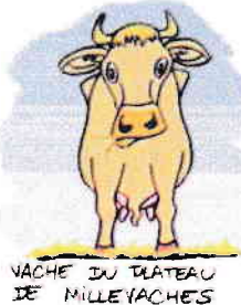
VACHE DU PLATEAU DE MILLEVACHES

de ceux qui s'opposent aux fermes industrielles qui pratiquent la traite intensive des vaches (3 fois par jour !!!) et dont le seul