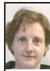
Le Boite Florence Lardy Cadre 3B

Elections du 3 au 6 octobre : votez pour la liste CGT.