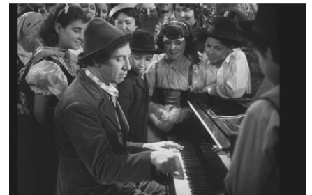
Chico Marx : Mit seinen Bürdern stets, und stets vorbildlichst, in sozialem Engagement