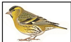
Tarin des aulnes