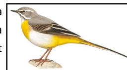
Bergeronnette des ruisseaux (hiver)

Certains pourraient la confondre avec la Bergeronnette des ruisseaux , mais la queue de cette dernière est jaune vif, et n'a pas de noir sur le dessus de la tête.