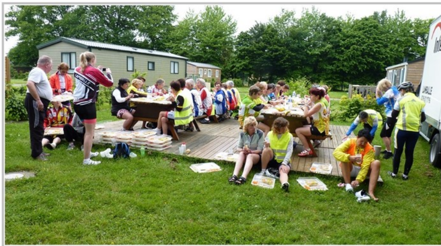
Le premier pique-nique a eu lieu à Combourg .