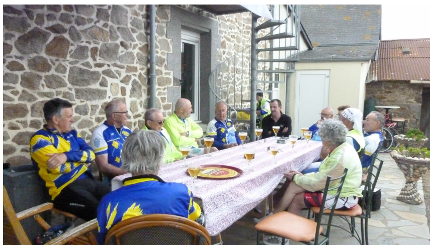
l'arrivée chez Régine 5ème. C'est gagné avec le président à l'arrivée