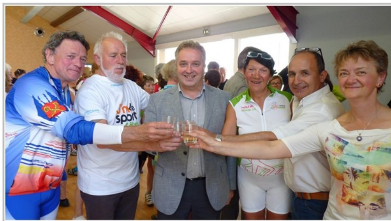
Instants chaleureux avec le Maire de la commune de Bischoffsheim

Un excellent moment restera en souvenir, au passage à Bischoffsheim . En effet, la municipalité nous a réservé un accueil extraordinaire, en considération de la particularité liée au jumelage de cette commune avec Ploubazlanec (22) .