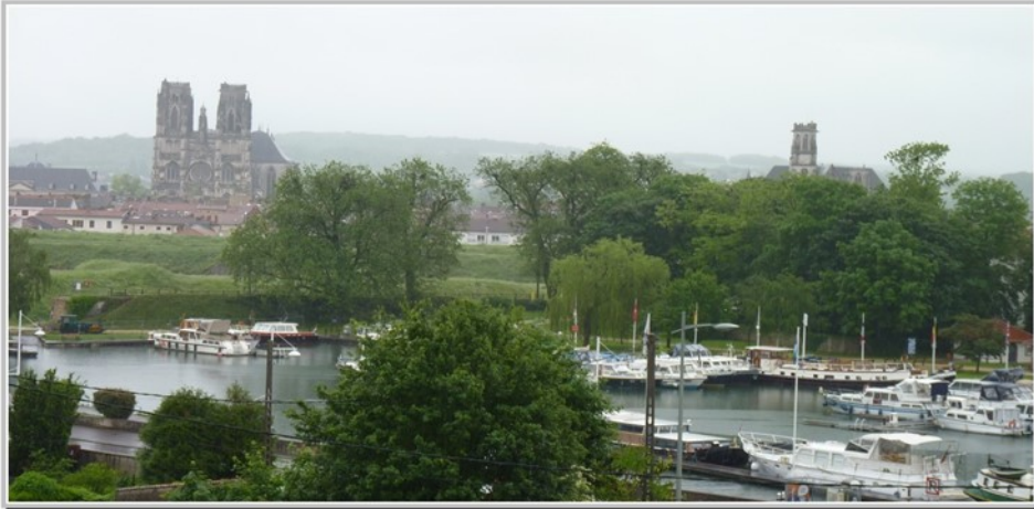
Toul est le théâtre (brumeux) du départ de la 7 e étape

Les vêtements de pluie sont encore de rigueur, au départ de la pause déjeuner à Flavigny-sur-Moselle .