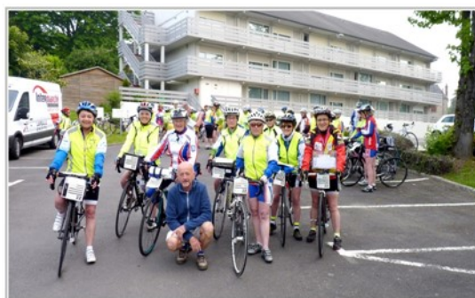
Départ de la 2è étape de l'hôtel de Fougères