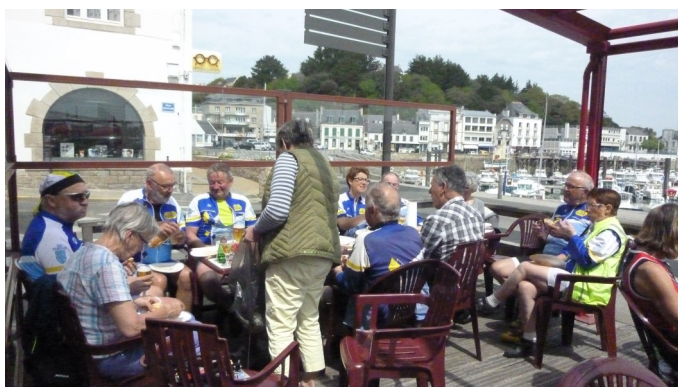
le pique nique sur le port à Audierne

Nous avons quand même réussi à atteindre Pouldreuzic, autre haut lieu de notre étape