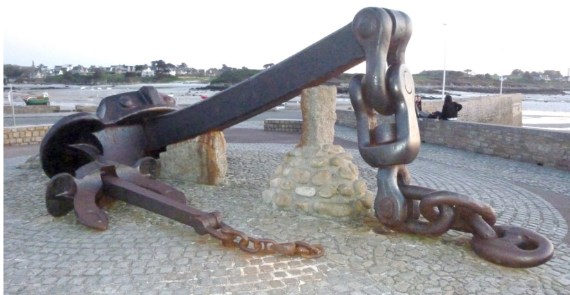
L'ancre de l'Amoko Cadiz à Portsall