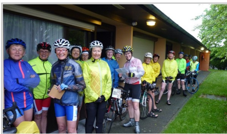
Au départ d'Alençon les filles avaient le sourire... malgré la pluie.

Toujours dans la bonne humeur, les participantes ont rallié successivement Chartres et Nemours . Elles progressaient en formant 5 groupes, pour assurer un maximum de sécurité .