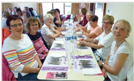
Dîner à Fougères au terme de la première étape