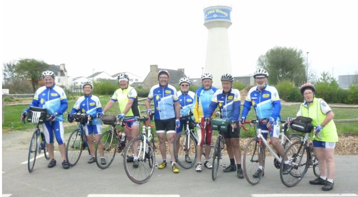
le pâté Henaff à Pouldreuzic

Arrivés en périphérie de Quimper, droit devant, on s'engage sur les ronds points sans la priorité, on coupe les priorités, toutes les voitures sont contraintes de s'arrêter et, en plus, certains s'engagent sur la 4 voies. TOUT FAUX. Pour la bien séance, je tairais une nouvelle fois les noms mais je suis le seul à avoir par-