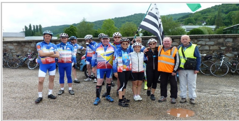
Le club de Bischoffsheim nous accueille à Schirmeck

Un excellent moment restera en souvenir, au passage à Bischoffsheim . En effet, la municipalité nous a réservé un accueil extraordinaire, en considération de la particularité liée au jumelage de cette commune avec Ploubazlanec (22) .