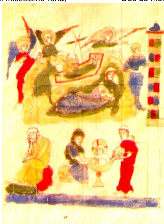
Nadal: Bíblia de l'abat Oliba de Ripoll, s. XI

El Déu cristià, en canvi, ha cridat de la mort el seu fill únic per a agermanar la humanitat sencera en el món de la resurrecció i de la vida. Fins i tot els més miserables, els més pobres, aquells que experimenten la seva vida sense sentit, carregada de sofriment i de misèria, poden emmirallar-se en Jesús, que ha donat la vida per la seva immensa família, per tots els qui, arreu del món, vulguin en ell dipositar la seva fe. No és en va que aquests dies ens repetim una cosa que deia Ireneu de Lió (+202), «que Déu s'ha fet home perquè l'home esdevingui Déu.»