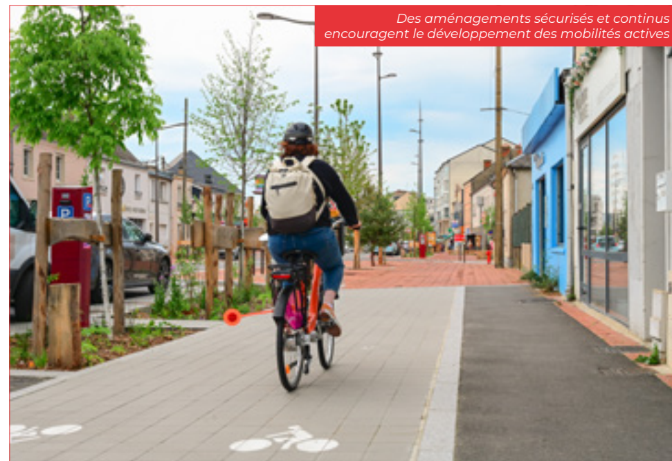
Des aménagements sécurisés et continus encouragent le développement des mobilités actives