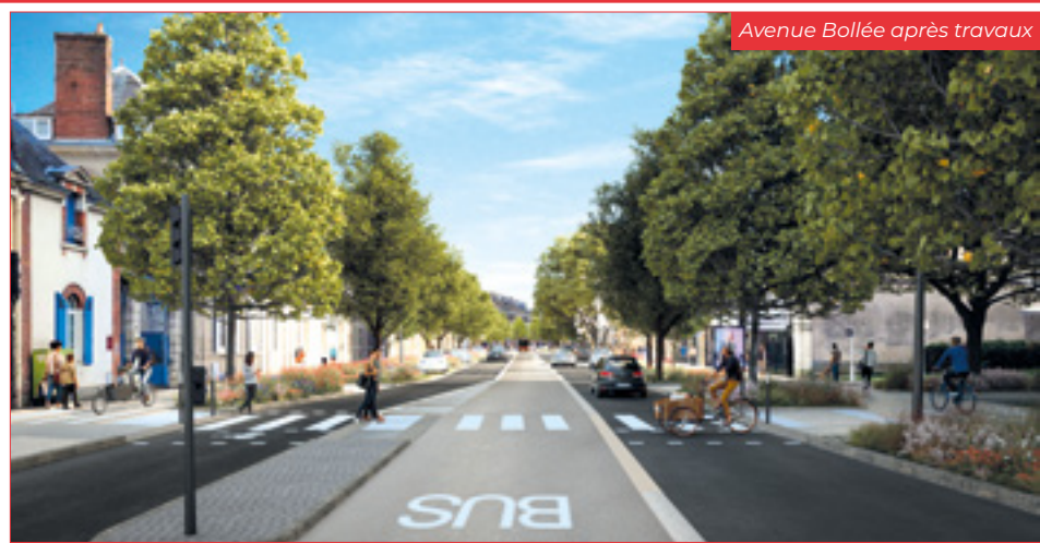
Avenue Bollée après travaux

La C5 conservera le tracé de l'actuelle ligne 5. Elle bénéficiera de la priorité aux carrefours tout au long de son parcours, avenue Félix-Geneslay, rue Chanzy et avenue Bollée notamment, pour éviter les embouteillages et garantir des temps de trajet optimaux. Le carrefour des Quatre-Pentes sera profondément remanié et transformé en giratoire végétalisé pour prioriser les Chronolignes et fluidifier la circulation générale.