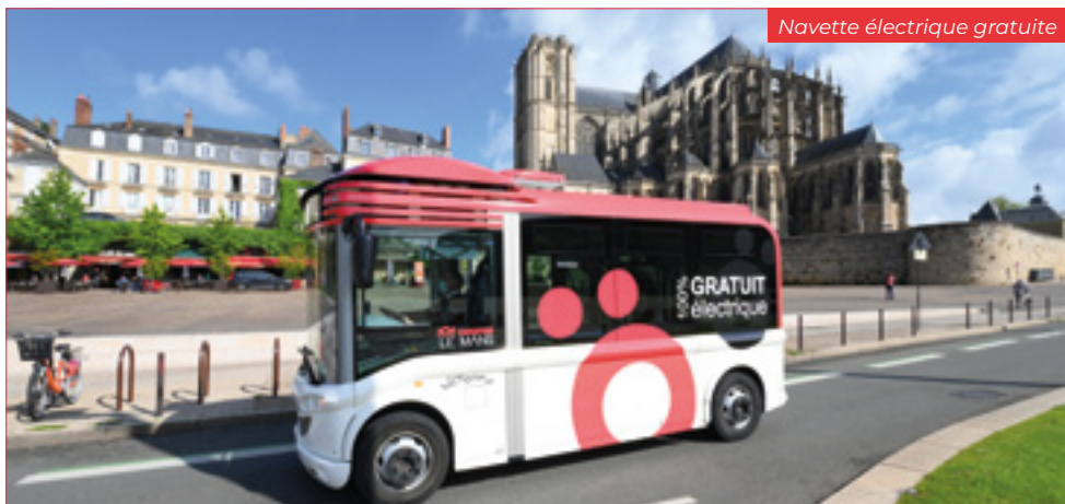
Navette électrique gratuite