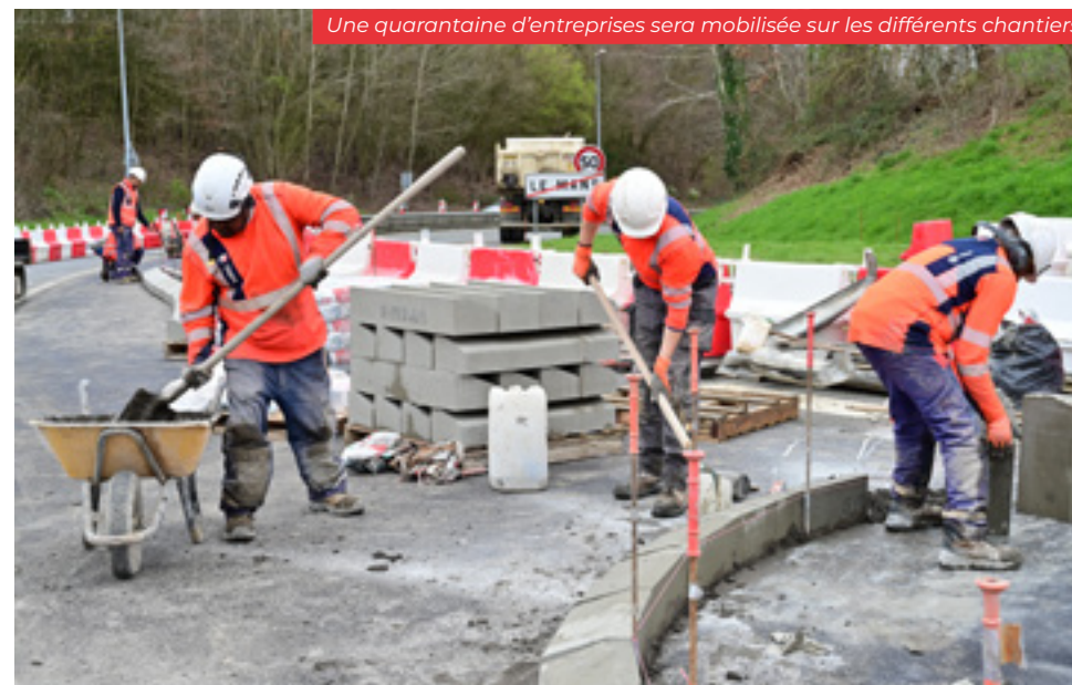
Une quarantaine d'entreprises sera mobilisée sur les différents chantiers

Des clauses d'insertion sociale incluses dans les marchés publics, permettront de consacrer 35 équivalents temps plein à des personnes éloignées de l'emploi sur toute la durée du projet.