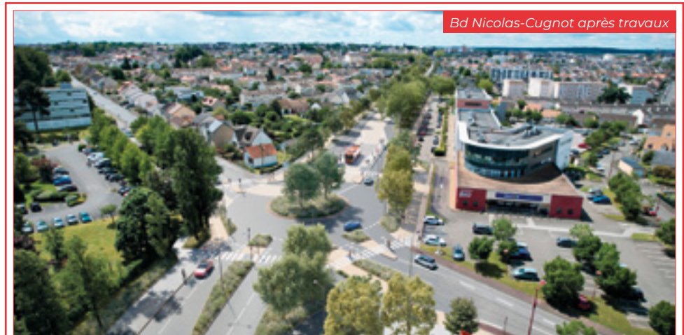
Bd Nicolas-Cugnot après travaux

Entre l'avenue du Docteur-Jean-Mac et Les Atlantides, un site propre central pour les bus dans les deux sens de circulation sera aménagé.