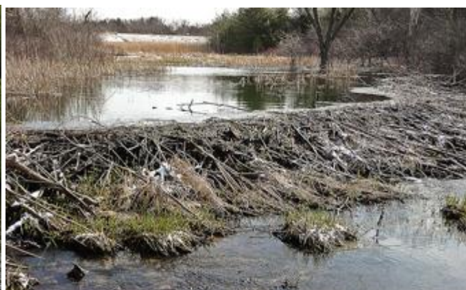
Un barrage de castors