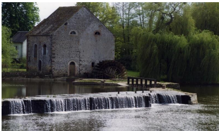
Une chaussée de moulin