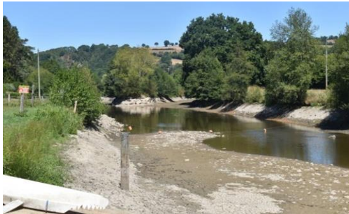
La Vire à quelques km près de Pont-Farcy après destruction d'une chaussée (on aperçoit l'ancien lit et le nouveau...)

Moulin Bichat rivière le Suran (Ain) en situation de rupture d'écoulement août 2022 :