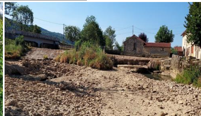
Aval de la chaussée : rivière à sec