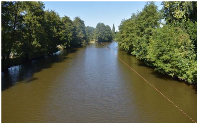
La Vire à Condé-sur-Vire en amont d'une des rares chaussées de moulin à avoir été conservée

Le fleuve côtier de la Vire en Normandie (Calvados) été 2022 :