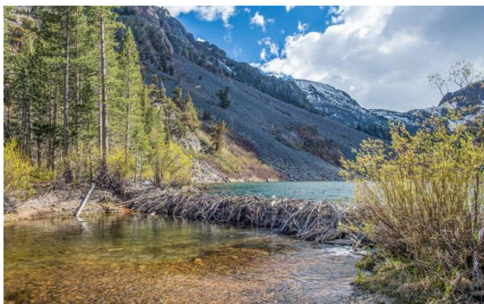
Chaussées de moulin