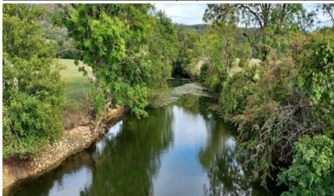
Amont de la chaussée : les eaux préservées sur des centaines de mètres et les milieux aquatiques avec

Moulin Bichat rivière le Suran (Ain) en situation de rupture d'écoulement août 2022 :