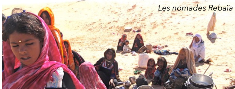
Les nomades Rebaïa