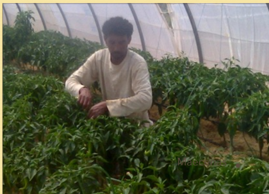
Serre légumière DNPLS installée en plein désert à 15 km de l'oasis d'El Faouar.