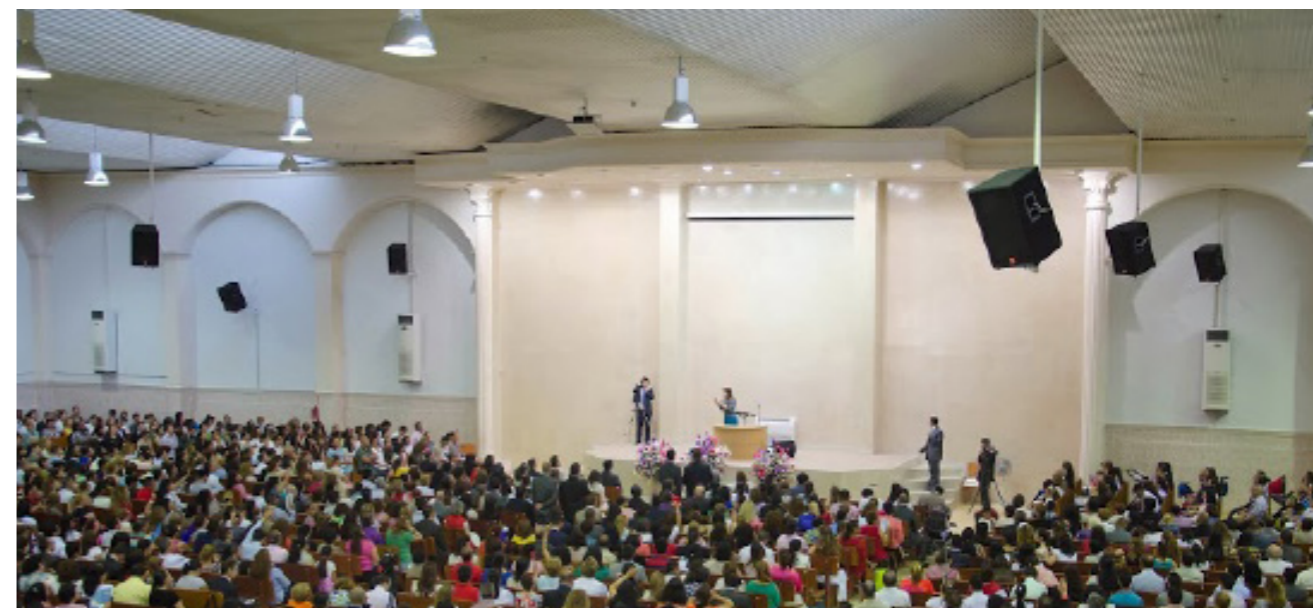
La líder de la secta se dirige desde lo más alto del púlpito a sus fieles, en la parte inferior, en la 'Iglesia' de Vallecas. Julio 2013.