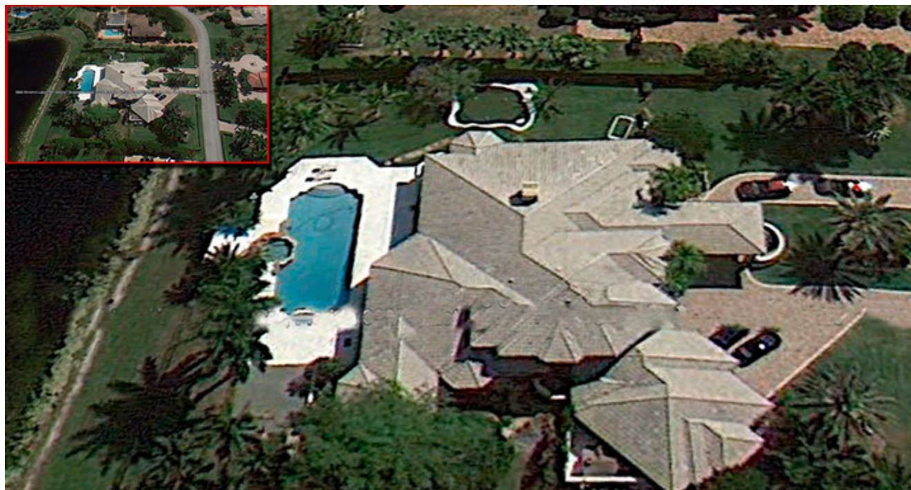
Lujosa propiedad de la familia Piraguive en Florida, EE.UU.

con autoridades de ambos países para esclarecer los hechos y poder juzgarlos, según la prensa local.