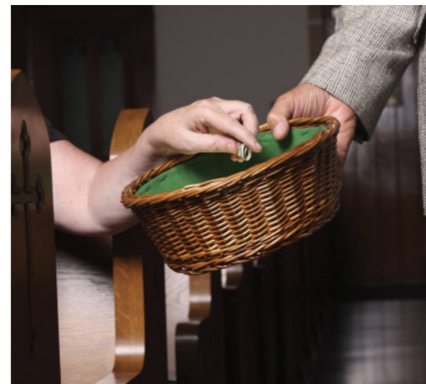
Mujer anónima entregando el diezmo a una secta.