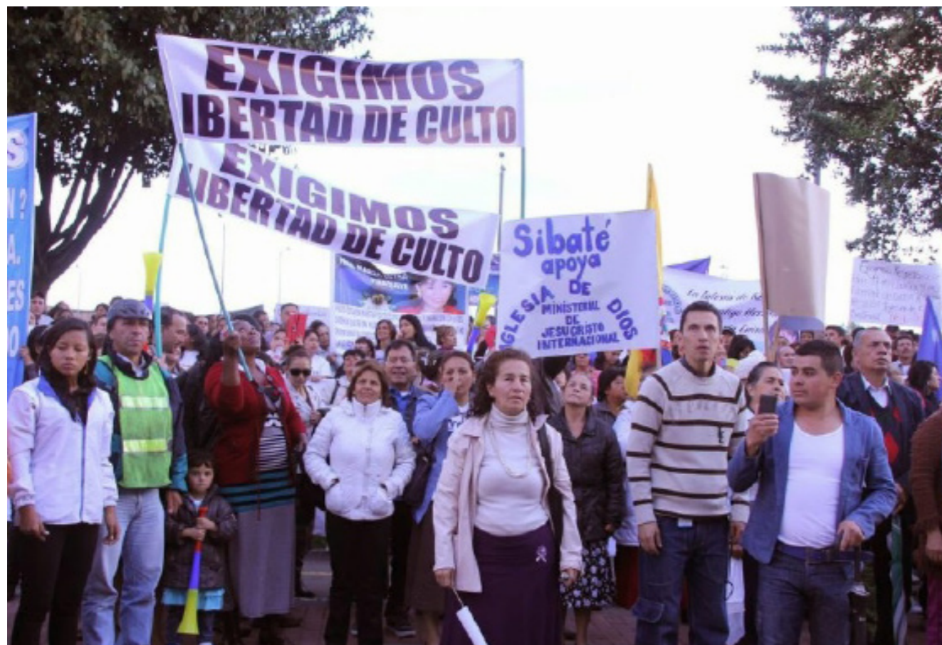
Creyentes de la IDMJI apoyan a la líder y protestan ante el canal RCN por la emisión del documental ¿Del cielo al infierno?