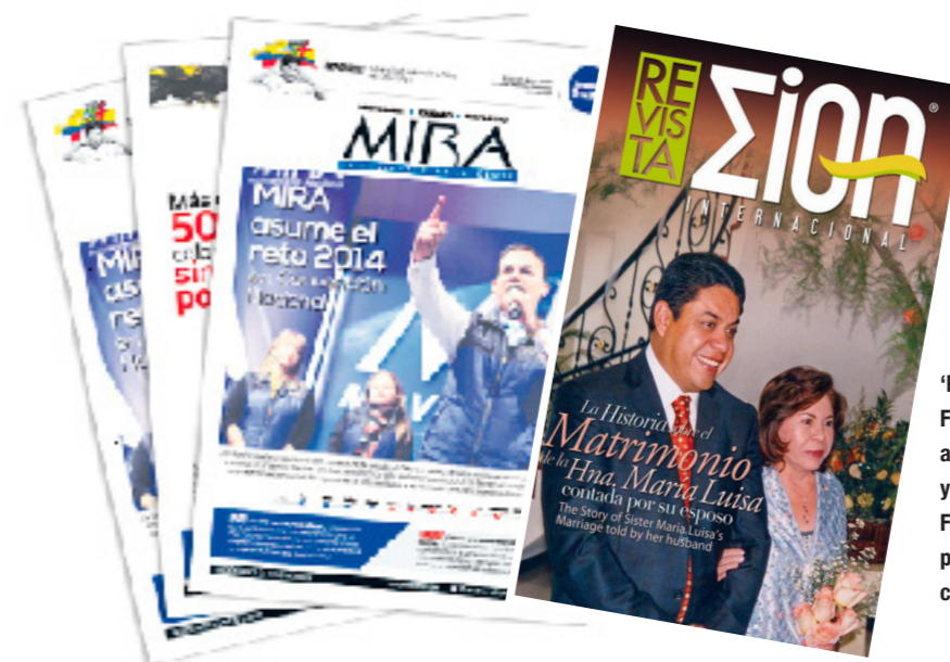
'Revista Zion' Fuente: www.androidpit.es; y 'Periódico'. Fuente: www.periodicomira.com

El domingo 2 de marzo, se realizó un encuentro en la sede del MIRA en Vallecas (Madrid), al que acudieron unas 2.000 personas, en su mayoría colombianos. Allí, se sugirió a los presentes votar por MIRA en las Elecciones legislativas de Colombia, celebradas el siguiente domingo. En la reunión, profetas, políticos y la líder (por videoconferencia) recordaron a los feligreses lo que se les dice en la 'Iglesia': "Hay dos caminos para entrar al reino de Dios: uno es la IDMJI y el otro MIRA".