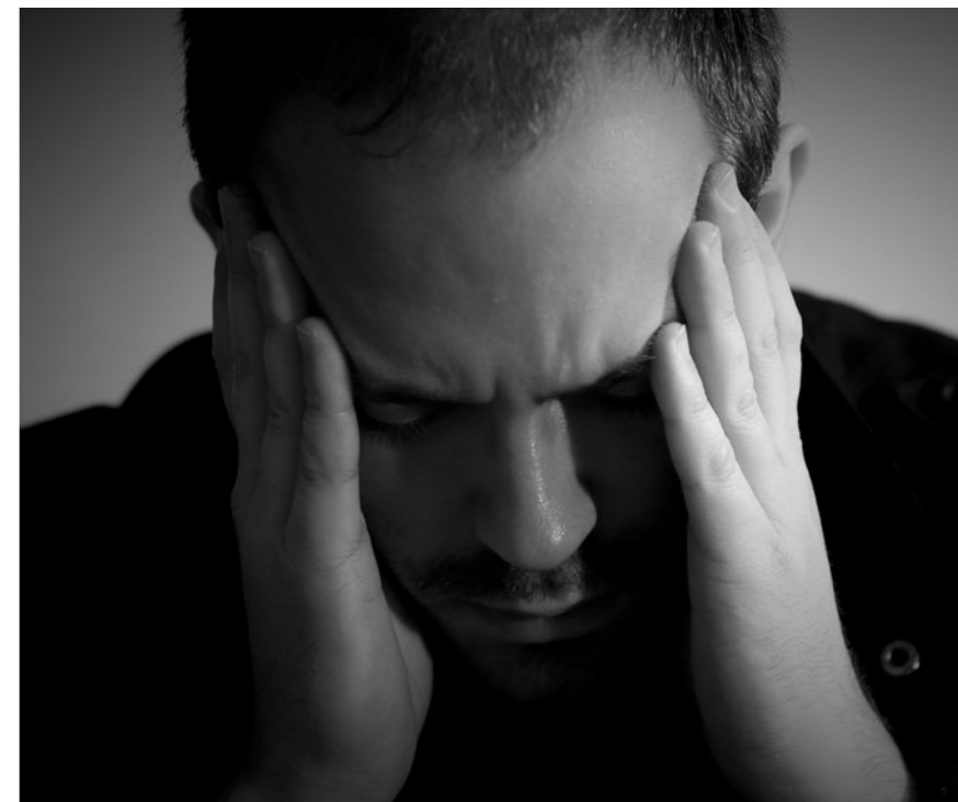
Depresión y aislamiento, rasgos comunes al salir de la secta.