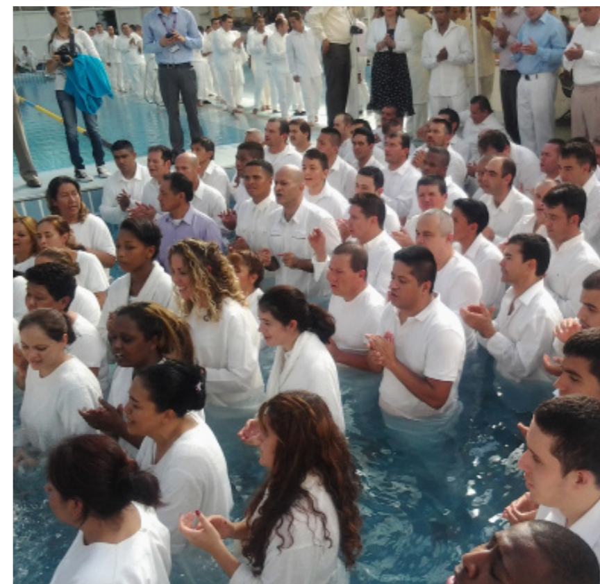
'Bautismo en Aguas' a nuevos conversos de los templos de Madrid, en el Centro Deportivo Municipal Moscardó, en el Distrito de Usera (Madrid). Septiembre de 2013. Damián Pérez.

A continuación, en segundo lugar, se sitúan los 'hermanos' conversos que también trabajan sin recibir ningún tributo para la casa de 'Dios', en las labores más básicas. En el tercero, los que imponen manos y profetizan. En el cuarto, administradores y pastores, que perciben entre 1.500-