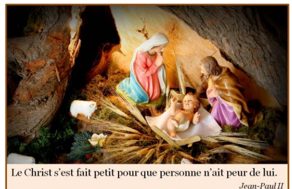
Le Christ s'est fait petit pour que personne n'ait peur de lui.