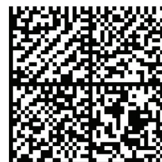
QR CODE pour CB