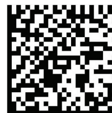
QR CODE pour PAYPAL