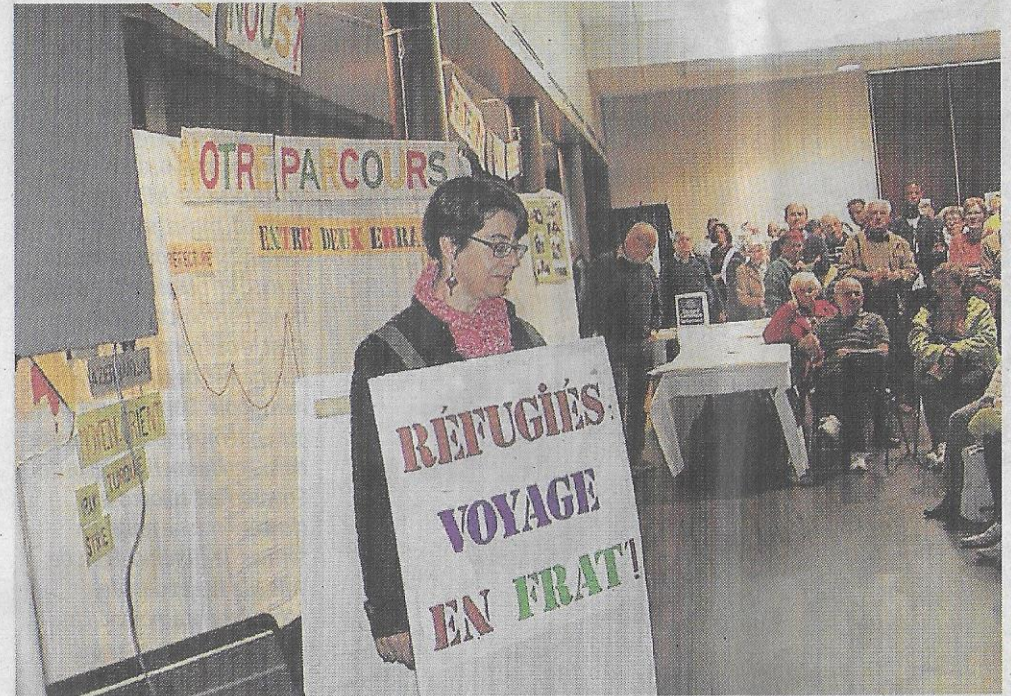
Les actions envers les migrants ont été mises à l'honneur.

La salle de l'Estuaire a accueilli une fête du vivre ensemble à l'occasion du 60 e anniversaire de la Mission ouvrière.