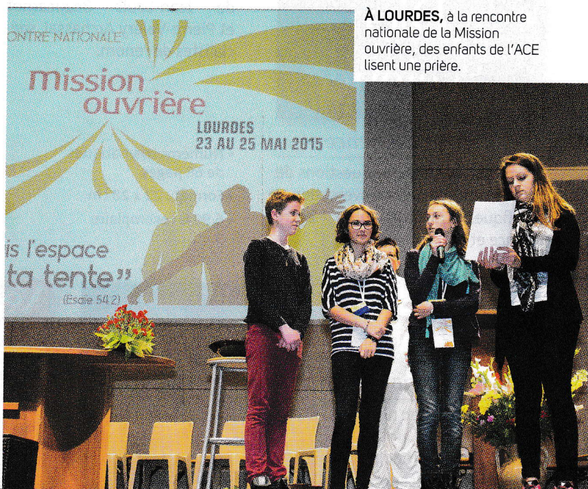
À LOURDES, à la rencontre nationale de la Mission ouvrière, des enfants de l'ACE lisent une prière.