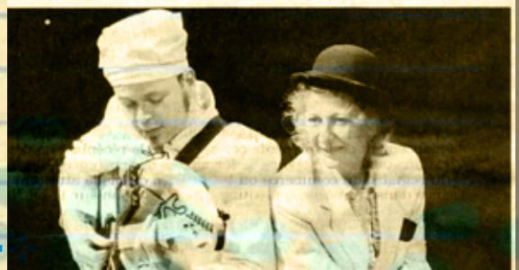
Sortilèges et petits pois. (Document remis)

► Les 18, 24, 25 et 27 février à 15h, les 21 et 28 à 18h. ☎ 03 88 35 70 10.