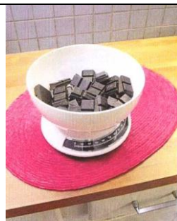
Balance de ménage

La livre est une ancienne unité de masse française qu'on utilise encore parfois pour désigner un demi-kilogramme.