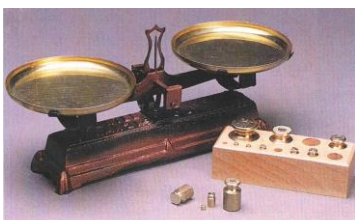
Balance Roberval et boîte de masses marquées