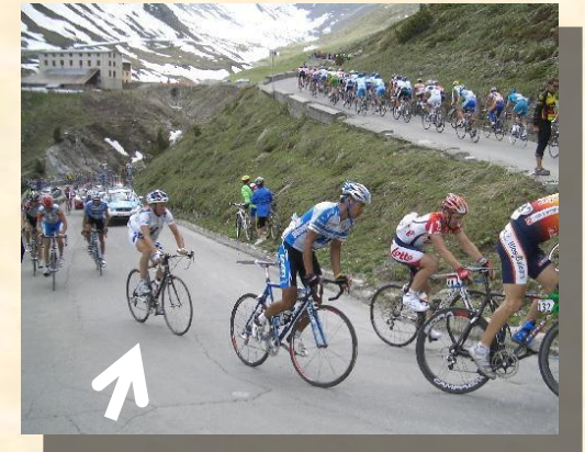
Mon Stelvio en mode « Gruppetto » 14 ème étape du Giro 2005

Puis suivra le versant nord du Stelvio, le plus difficile! 24,3 kms à 7,5% de moy (9,2% max) à gravir, ponctués de pas moins de 48 virages en épingle , numérotés dès le pied de l'ascension.