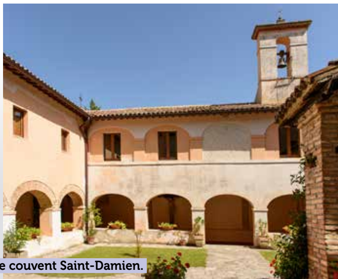
Le couvent Saint-Damien.

Transfert en minibus vers le centre d'Assise.