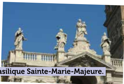
La basilique Sainte-Marie-Majeure.

30 places à réserver auprès de la compagnie Easyjet :