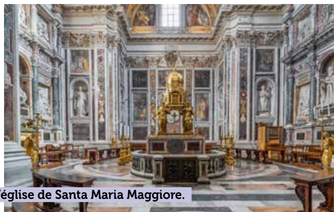
L'église de Santa Maria Maggiore.

Puis vous vous rendrez à l' église de Santa Maria Maggiore , également connue sous le nom de sanctuaire de la Spoliation . Ce sanctuaire est le lieu où saint François s'est dépouillé de toutes ses richesses. C'est dans ce lieu aussi que repose le bienheureux Carlo Acutis, béatifié le 10 octobre 2020 à Assise. Dans ce sanctuaire comme dans d'autres églises d'Assise, le jeune Carlo participait à la célébration eucharistique, qui était pour lui un rendez-vous quotidien. Le sanctuaire est fréquenté par de nombreux pèlerins, mais surtout de nombreux jeunes qui viennent méditer sur le geste du dénuement de François et prier sur la tombe de Carlo.