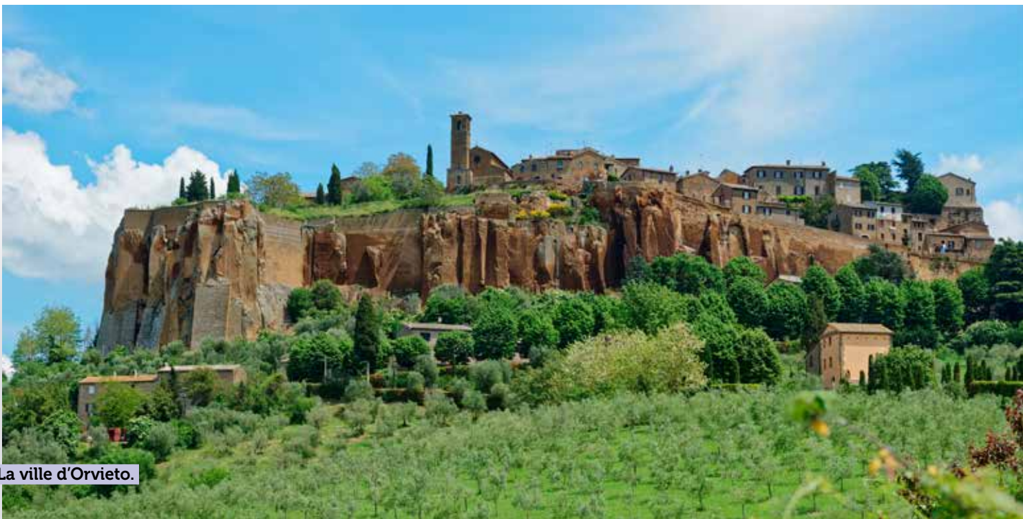
La ville d'Orvieto.

L'ordre des visites peut être soumis à certaines modifications pour des raisons de logistique. Cependant, l'ensemble des visites mentionnées au programme sera respecté.