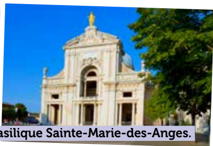
La basilique Sainte-Marie-des-Anges.