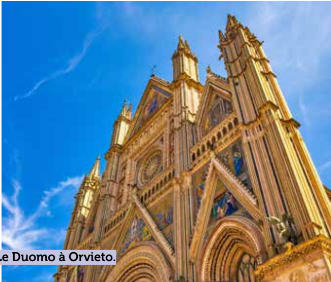
Le Duomo à Orvieto.