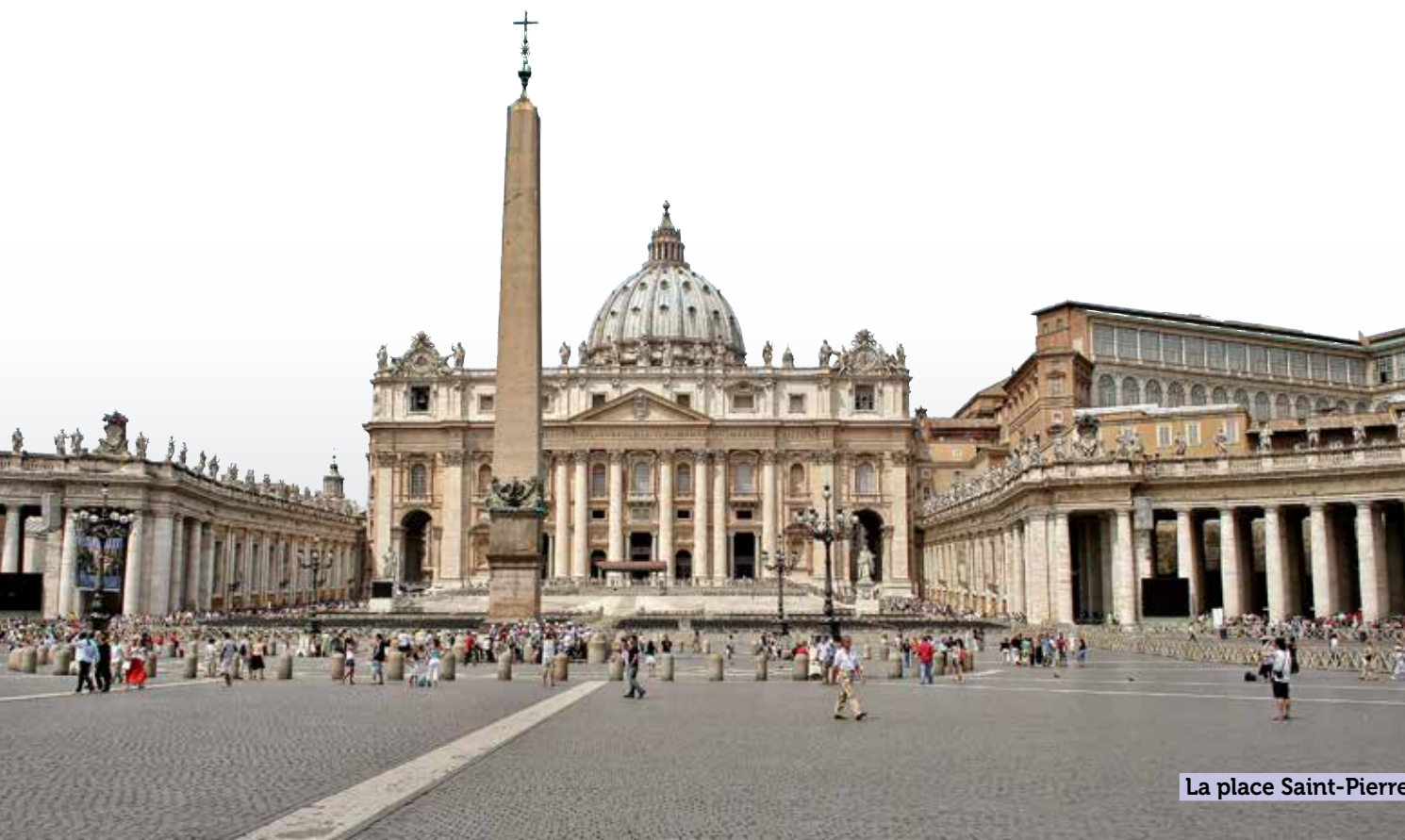
La place Saint-Pierre.

Possibilité de célébrer la messe dans la basilique à la chapelle Ad Caput (sous réserve).