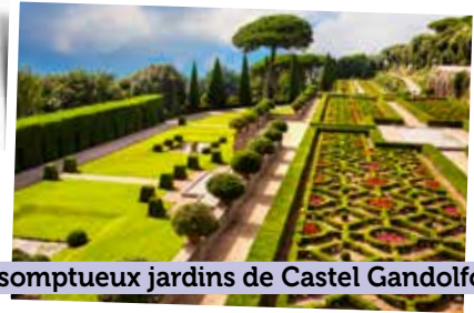
Les somptueux jardins de Castel Gandolfo.

Départ en autocar vers Orvieto (93km - 2h de route environ).