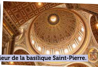
Intérieur de la basilique Saint-Pierre.