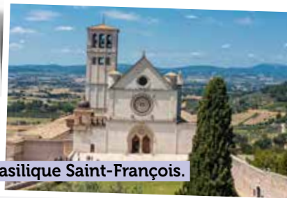
La basilique Saint-François.